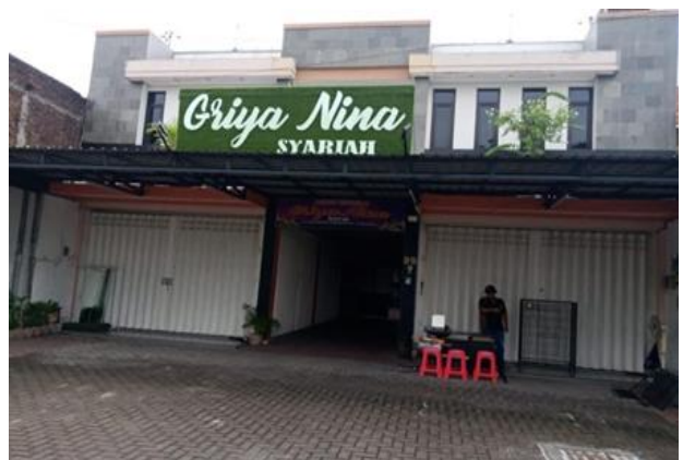
Jl. Rungkut Menanggal No 35