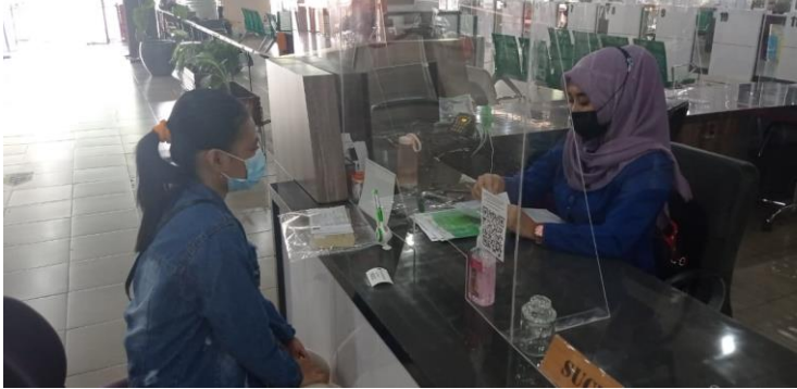
Pelayanan Loker Informasi