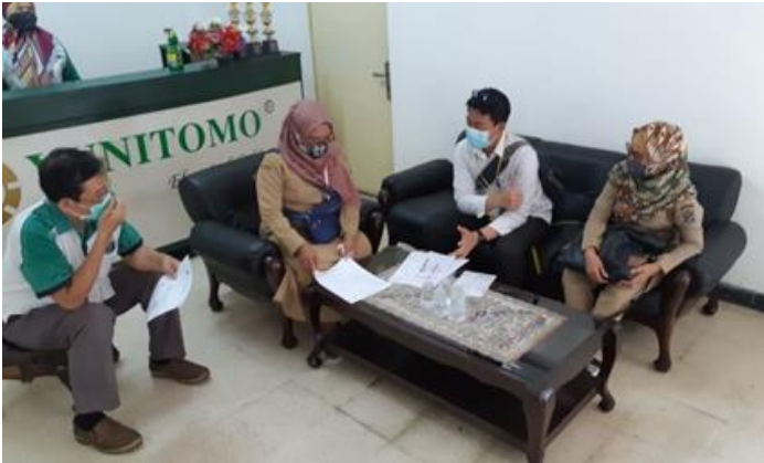
PT Central Wire Industrial (PMDN) Jl. Rungkut industri raya no. 17A