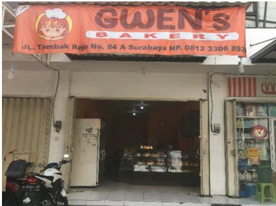
TokoGwens Bakery Jl. Tambakrejo 84-A