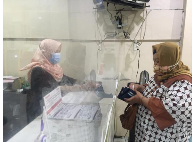
Pelayanan Loker Bank Jatim