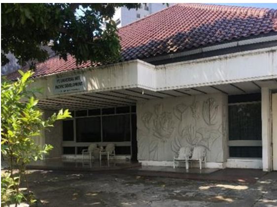
PT Universal Inti Pacific Development Jl. Sumatera No. 91