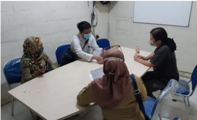
CV Indo Tehnik (PMDN) Jl. Rungkut industri IX no. 4-6