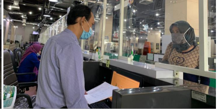
Pelayanan Loker Pengambilan