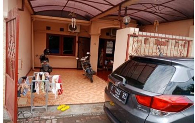
Wisma Gunung Anyar Selatan XV/34