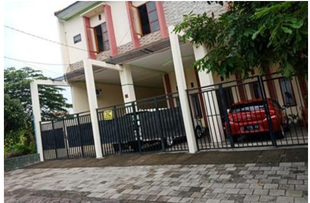
Jl. Gunung Anyar Indah III No.34