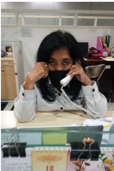
PT Baba Rafi Internasional