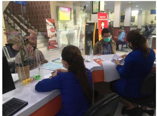
Pelayanan Loker Informasi

Jumlah Permohonan Perizinan Yang Masuk Sebanyak 111 Berkas