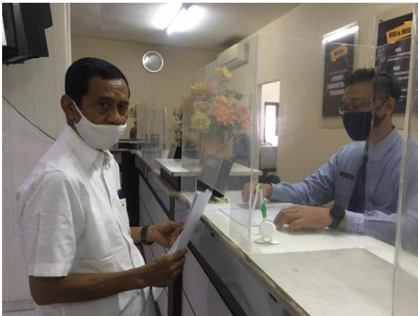
Pelayanan Loker Customer Service