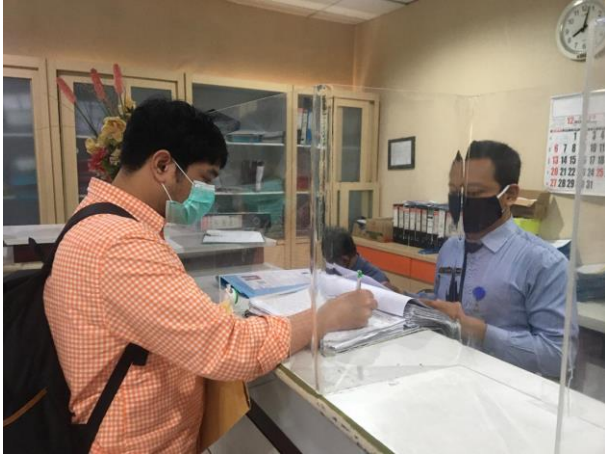
Pelayanan Loker Pengambilan