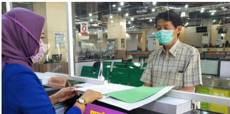
Pelayanan Loker Customer Services

Jumlah Permohonan Perizinan Yang Masuk Sebanyak 89 Berkas