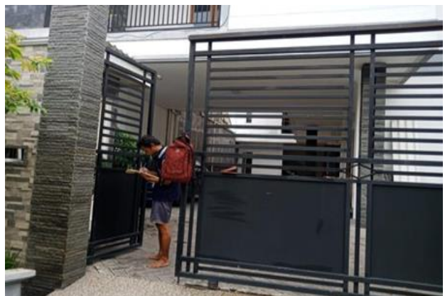
Jl. Gayung Barat II No. 21