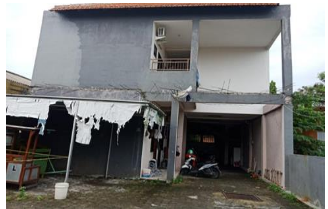
Jl. Gunung Anyar Tambak Utara 1 No 20