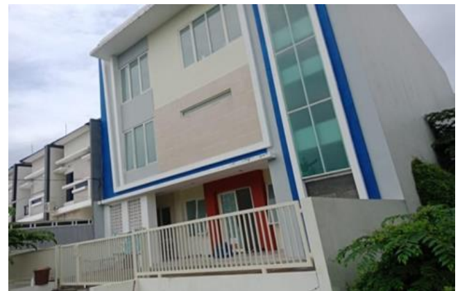
Jl. Gunung Anyar Indah Tengah XIV/57