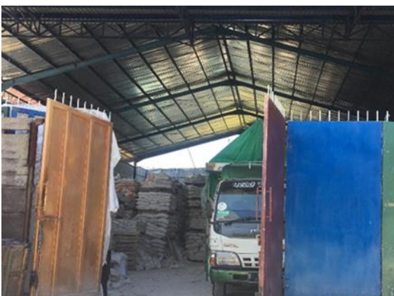
CV Rainbow Pelangi Jl.Dr.Ir H. Soekarno 9 No.14