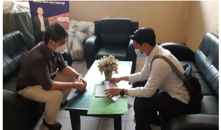
PT Multi urethane Indonesia (PMDN) Jl. Rungkut inrustri raya no. 79