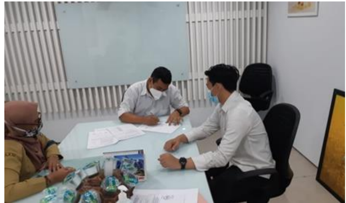
PT Citra Nutrindo Langgeng (PMDN) Jl. Rungkut industri I no. 21

Jumlah Perusahaan yang Diberikan Pengawasan/Survey Sebanyak 4 Perusahaan