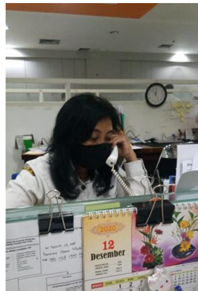
PT Baba Rafi Indonesia

Jumlah Perusahaan yang Diberikan Asistensi Online Sebanyak 2 Perusahaan