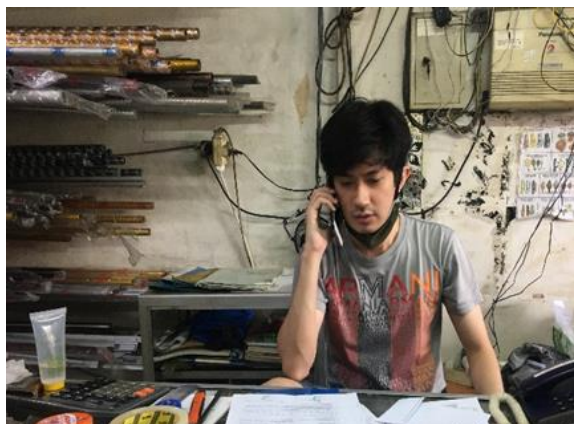
UD Terus Jaya Jl.KapasanSampingIII/36-A