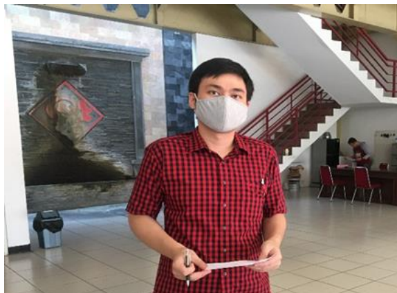
Makmur Sentosa Jl. Pucang Anom Timur No. 23A